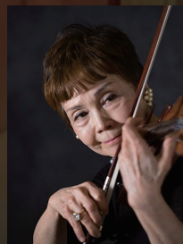
久保 陽子 ヴァイオリン